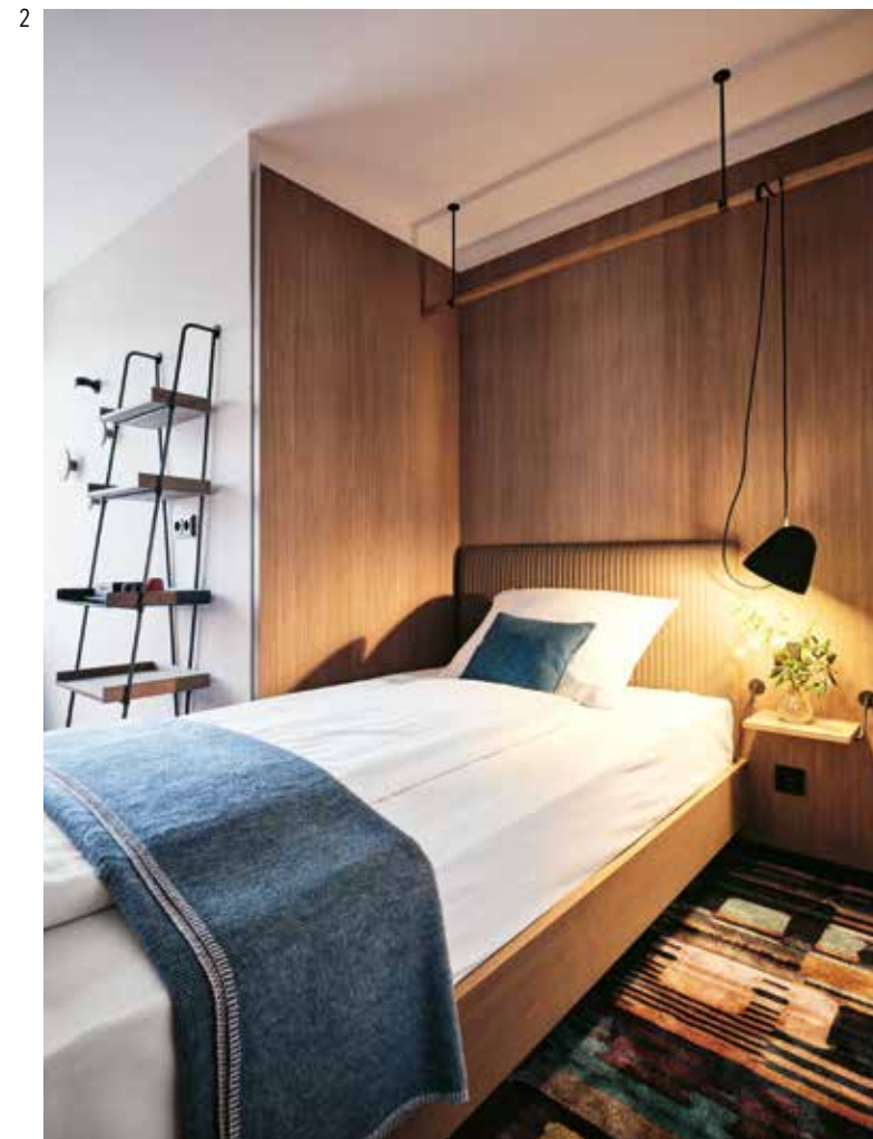
Möbeldesign: TON Merano Stühle Tassilosaal; Theca Moro Sessel Hotelzimmer | Beleuchtung: Nyta Tilt Pendelleuchte, Tilt Wall Wandleuchte, Tilt S Floor Hotelzimmer

2+3 In den Zimmern zeigen die Interior Designer der meierei „bayerische Tradition, ohne die typischen Klischees zu bedienen“: geschmiedete Möbelemente, offene Regale und Tableaus als „Helfer für die Gäste“, Lehmputzwände im Kontrast mit hellem Sichtestrich und langflorigen Rugs, schlichte Möbel und Wandverkleidungen aus Eichenholz – und nicht zuletzt zehn Fensterelemente mit alten Bleiverglasungen, die für die Doppelzimmer aufwendig restauriert wurden.