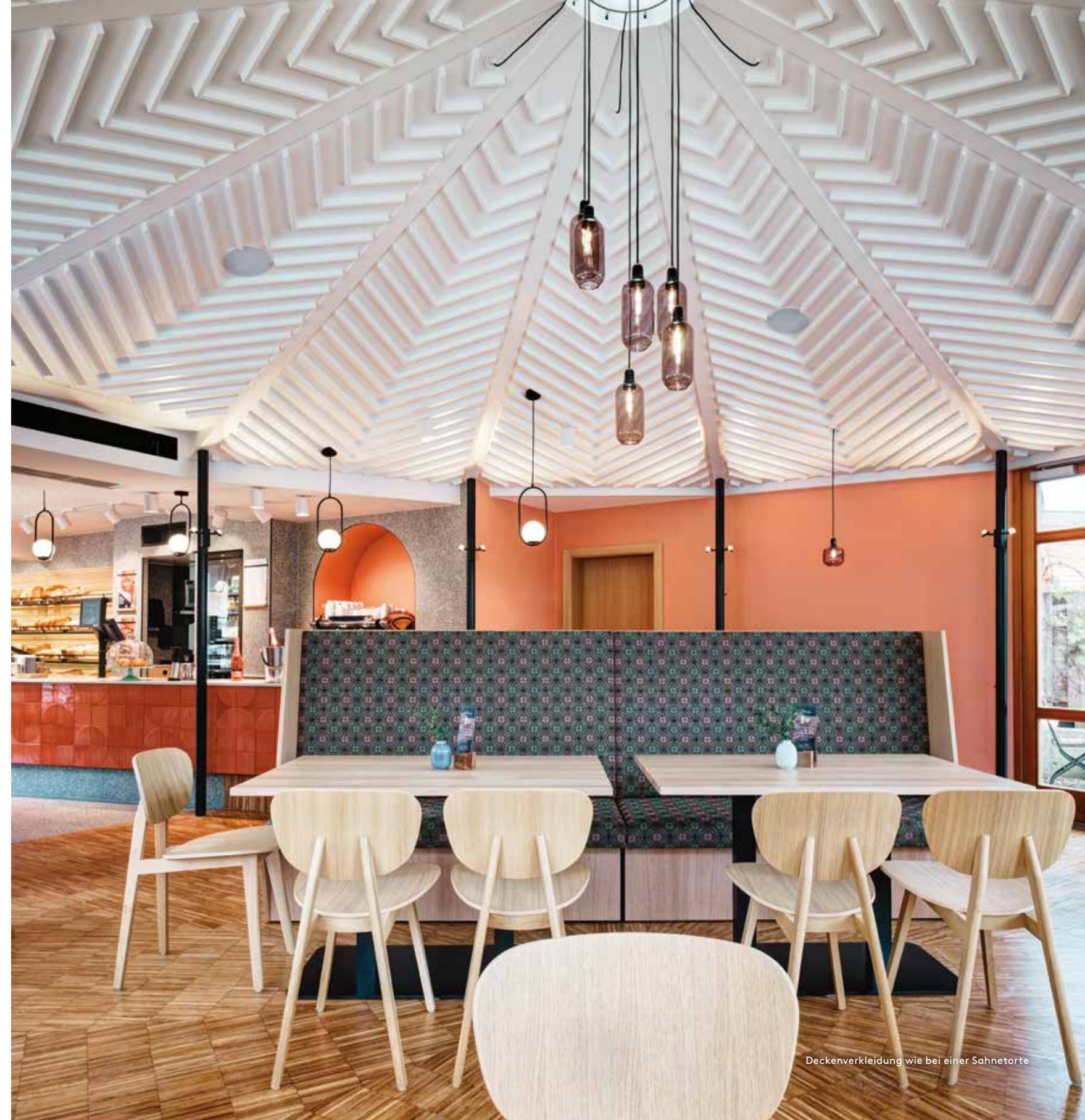
Deckenverkleidung wie bei einer Sahnetorte