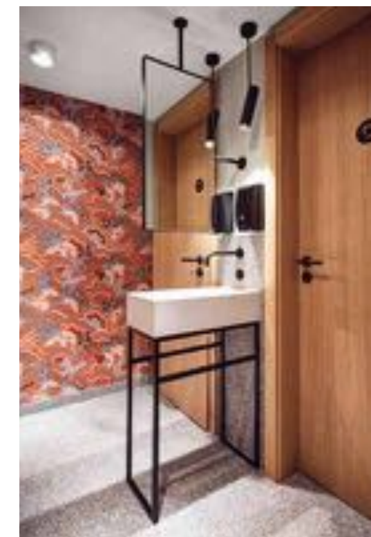
Der Vorräum der stillen Örtchen

Conversion of a shop with café – Chieming is located on Lake Chiemsee, also known as the Bavarian Sea. 250 metres further on is the Stumhofer bakery, which has existed there since 1792. After the conversion of the main building, customers entering the shop are greeted by an almost Italian atmosphere.