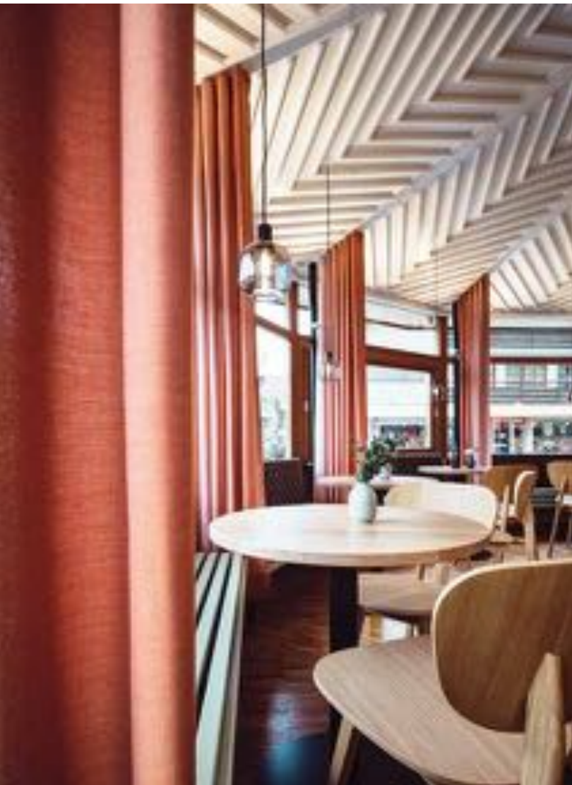
Die „schwedischen“ Gardinen trennen die umlaufende Sitzbank in kleinere Sereeps.