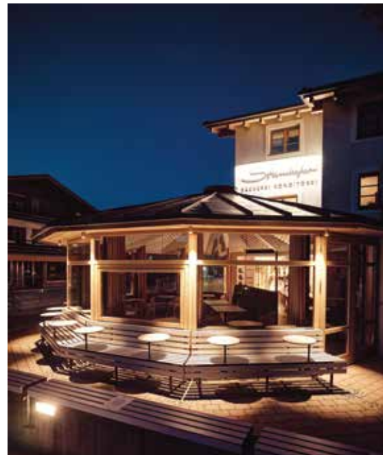
Wie eine Perlenkette reihen sich runde Tische.