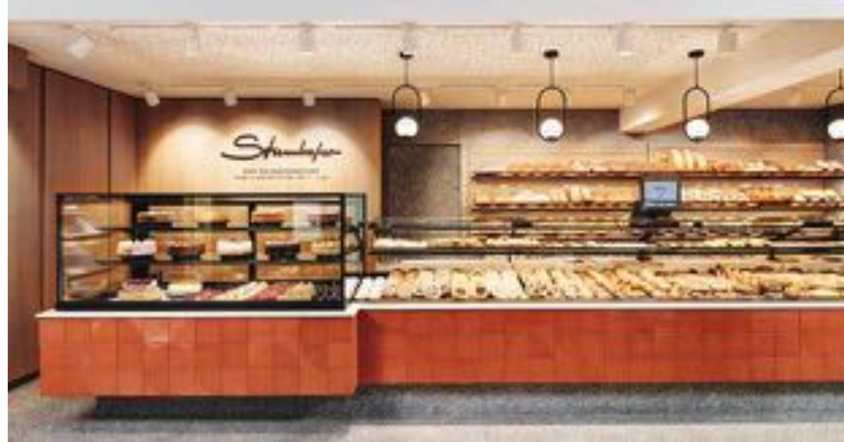
Die lange Praline