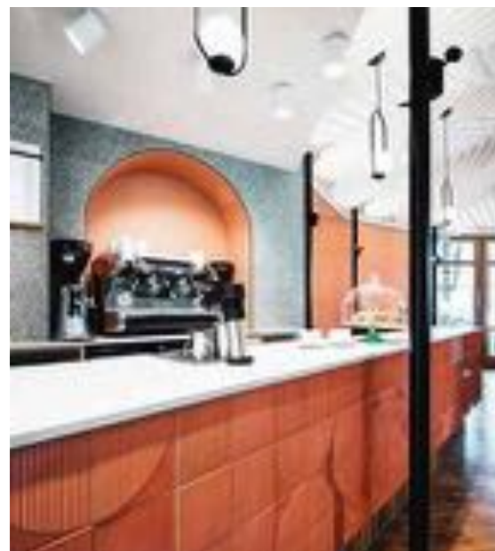
Der freigelegte Hauseingangsbogen inszeniert die Kaffeemaschine.

Wie eine lange Praline liegt die neue Lendentheke im Geschäft, eingebettet in elegant grüngraue Terrazzoflächen und warme Eichenwandverkleidungen. Geschmückt mit handgefertigten Ornamentfliesen, präsentiert sie höchst appetitlich das hochwertige Sortiment hausgemachter Torten, Kuchen und Gebäck. Die goldglänzende, gebackene Pracht findet sich im fein gestalteten Brotregal an der Rückwand und macht die Auswahl zu einer echten Versuchung. So schmeckt Brot!