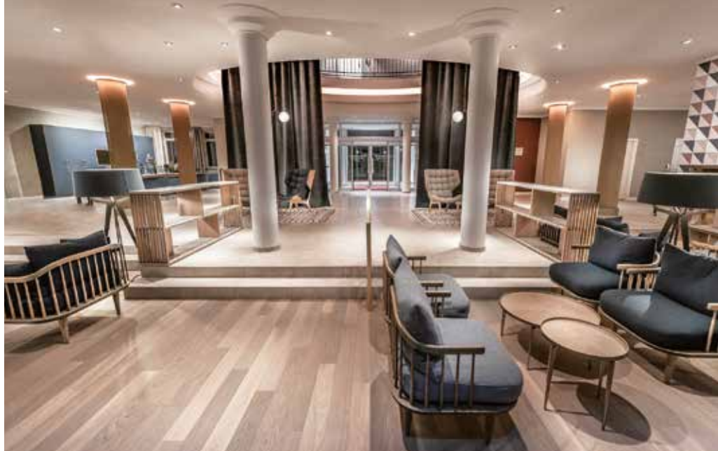
Die Blickachse in der Lobby, vom Eingang über die Lounge bis hin zur weitläufigen Terrasse und auf den Golfplatz, wird von zwei bodentiefen Vorhängen umrahmt. Das Farbschema ist natürlich und elegant.

Weitere Gastro-Bereiche sind die Treudelbar und das Restaurant Lemsahler. Beide konnten aufgrund der niedrigen Belegung im Mai noch nicht wiedereröffnen. Die Gestaltung ist wie im Rest des Hotels geprägt von vielen natürlichen Erd- und Holzönen, kombiniert mit maritimem